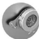
Sécurité CE EC security

Body and propeller well protiled to have a perfect mincing